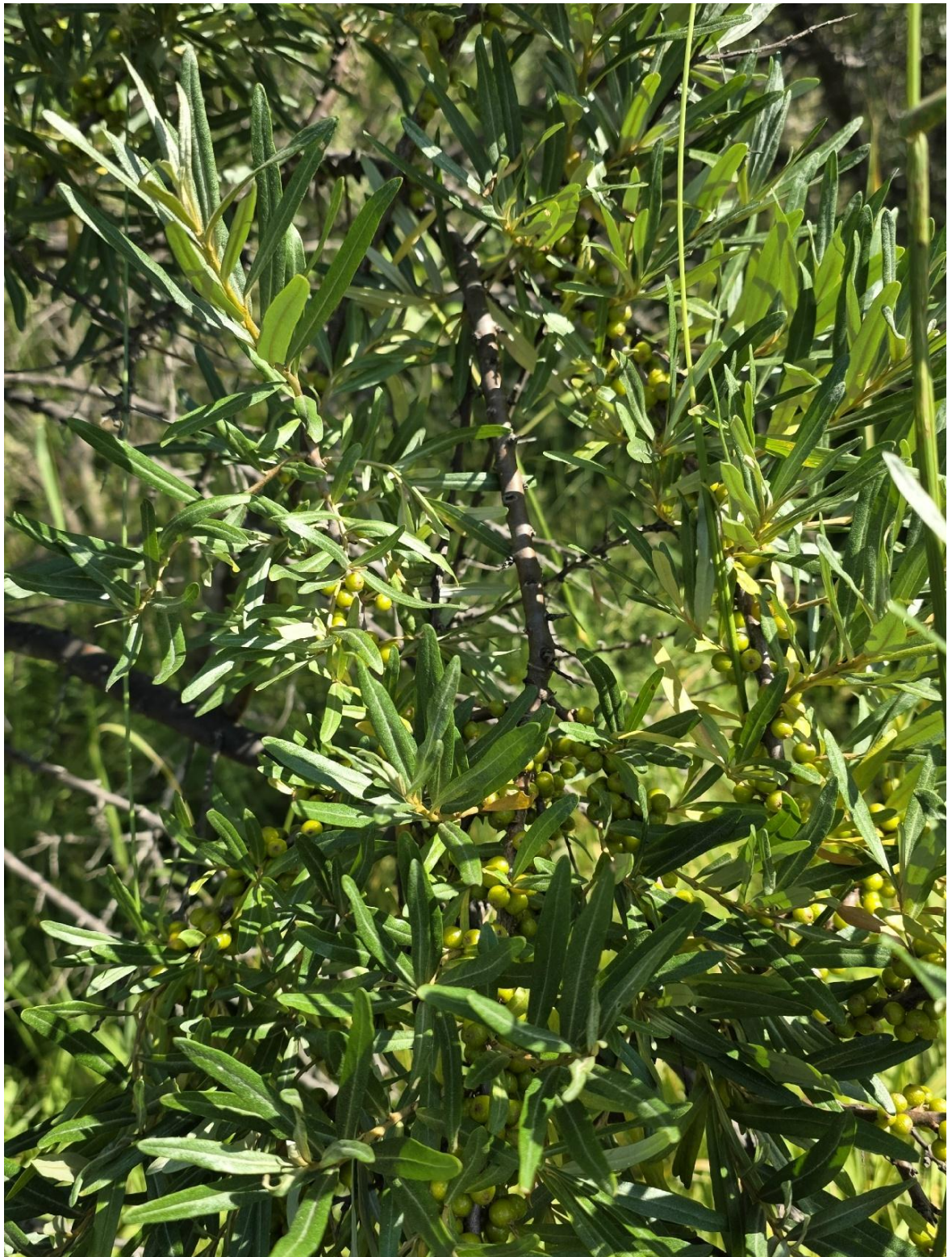
Фото 9. Плодоношение облепихи.