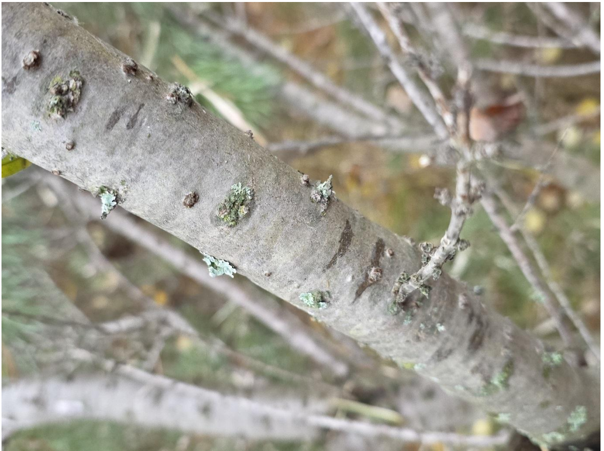
Фото 19. Лишайники на стволе