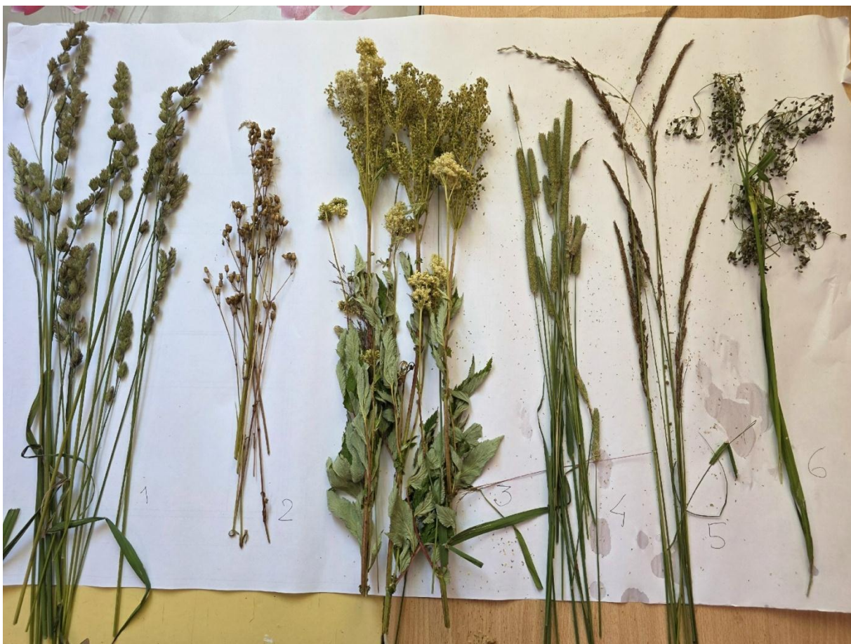
Фото 5. Основные представители живого напочвенного покрова.