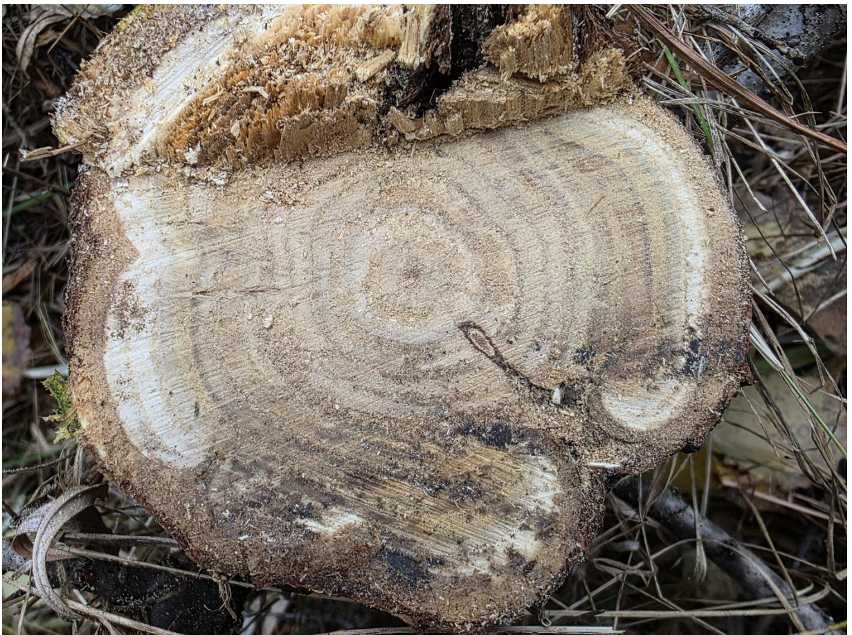
Фото 20. Определение возраста