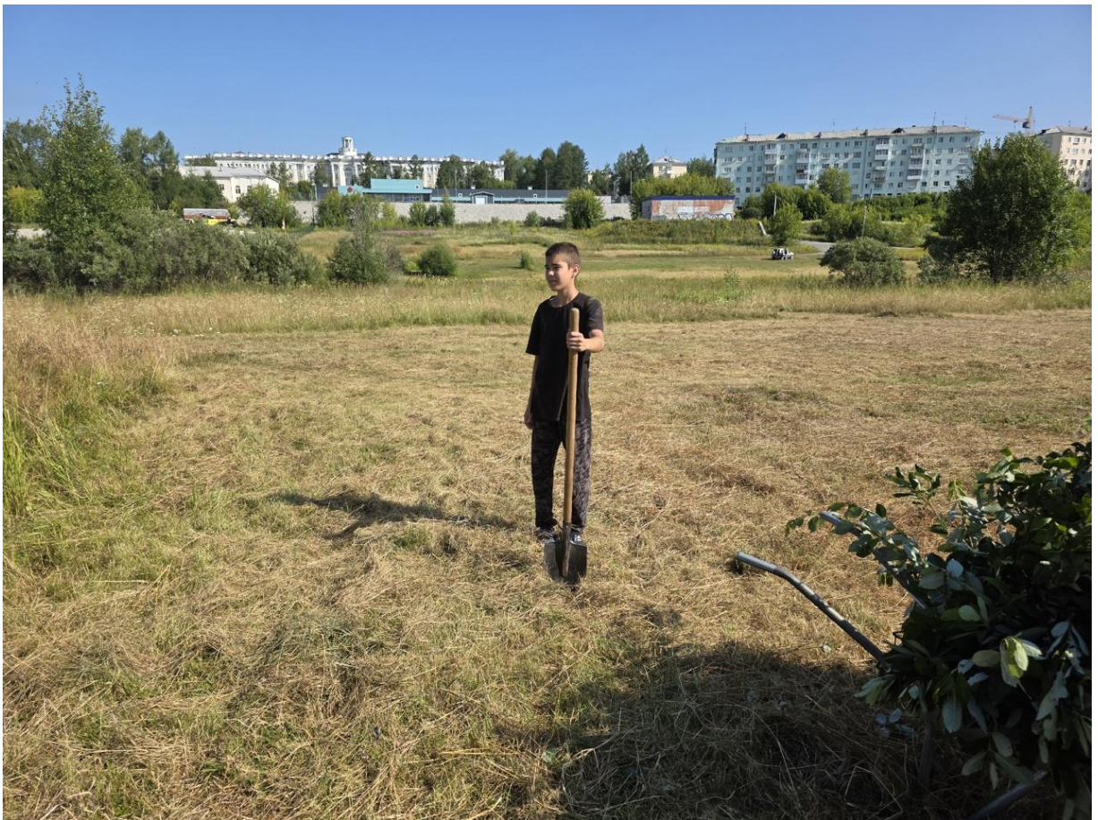
Фото 2. Взятие проб почвы.