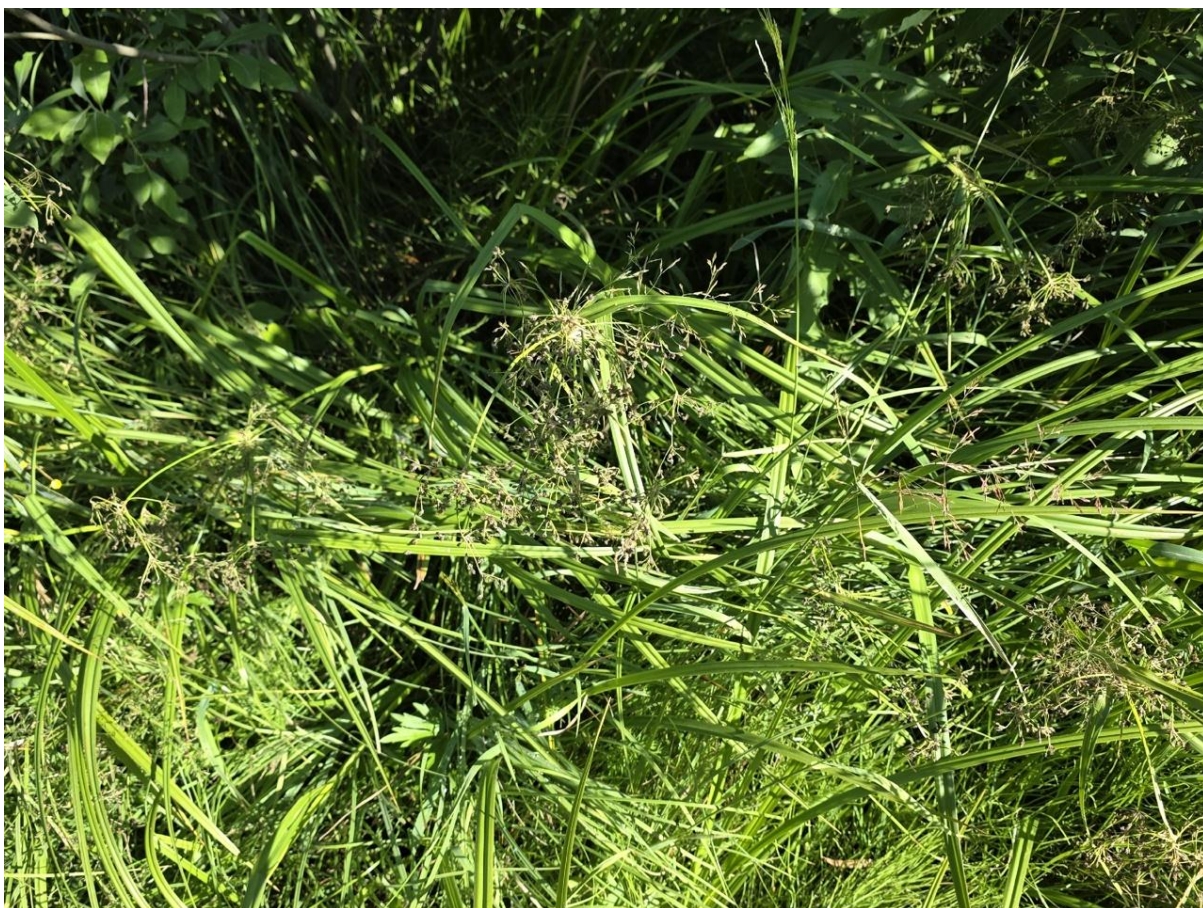
Фото 3. Живой напочвенный покров. Камыш лесной.