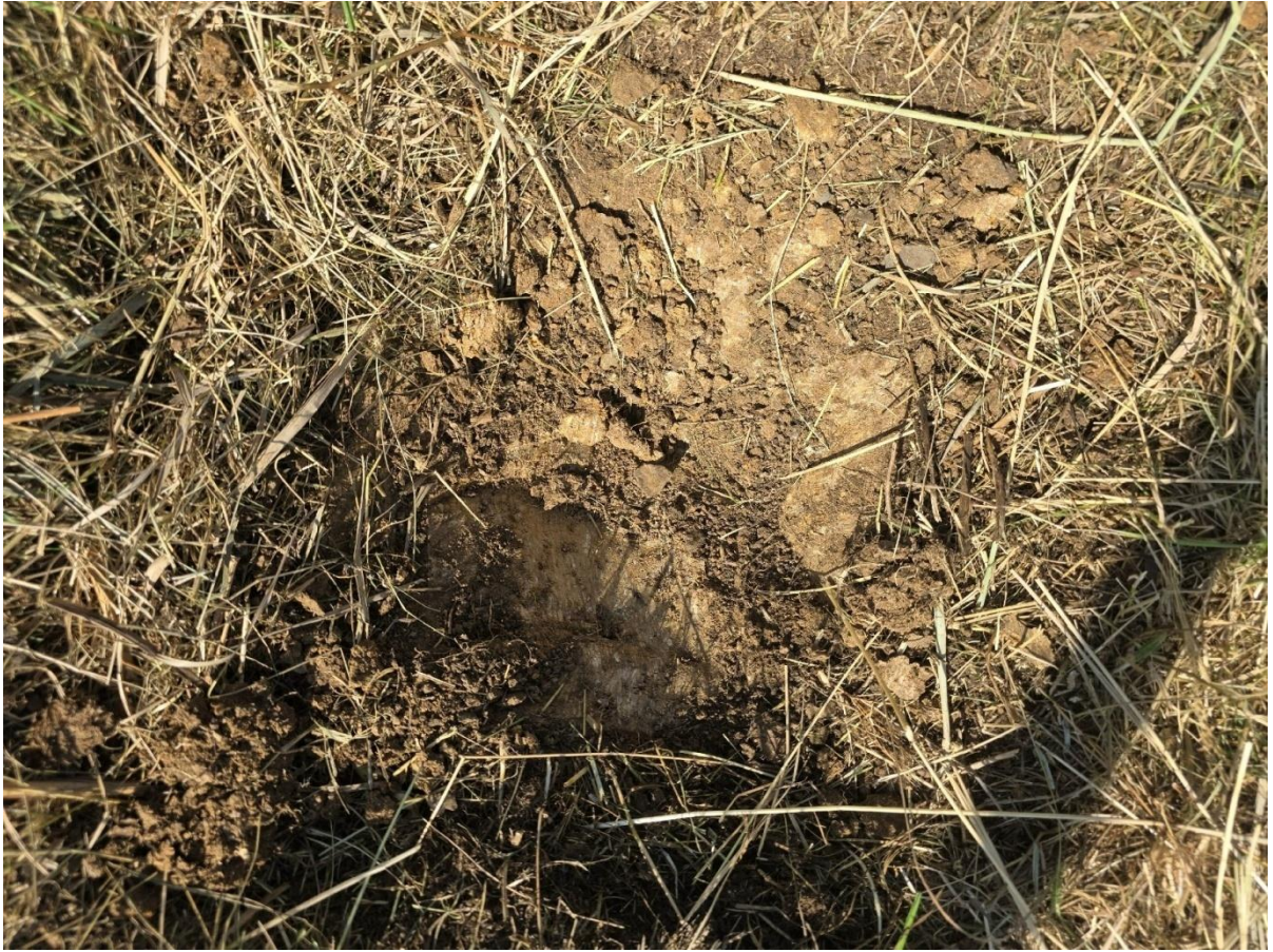
Фото 11. Выборка почвенного образца.