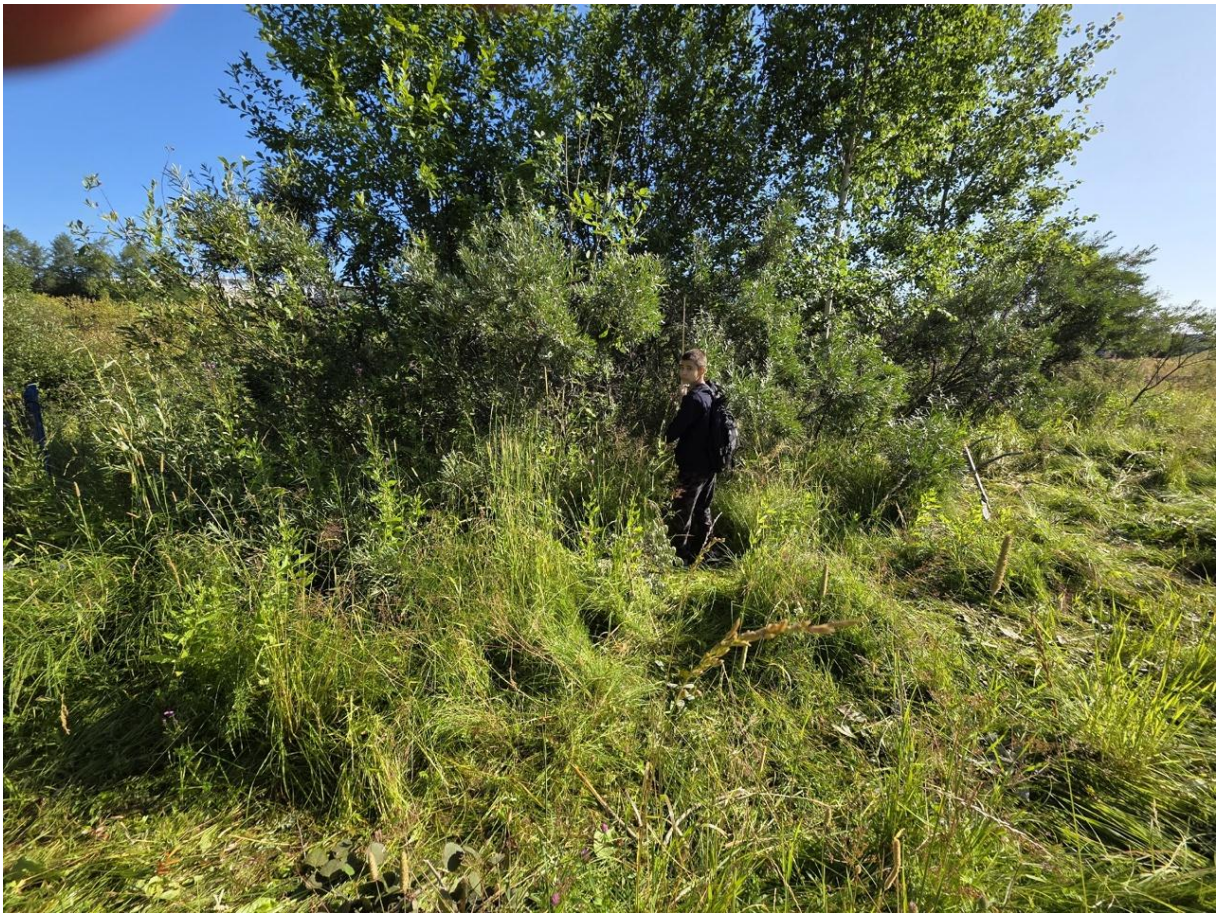
Фото 14. Замеры высоты облепихи.