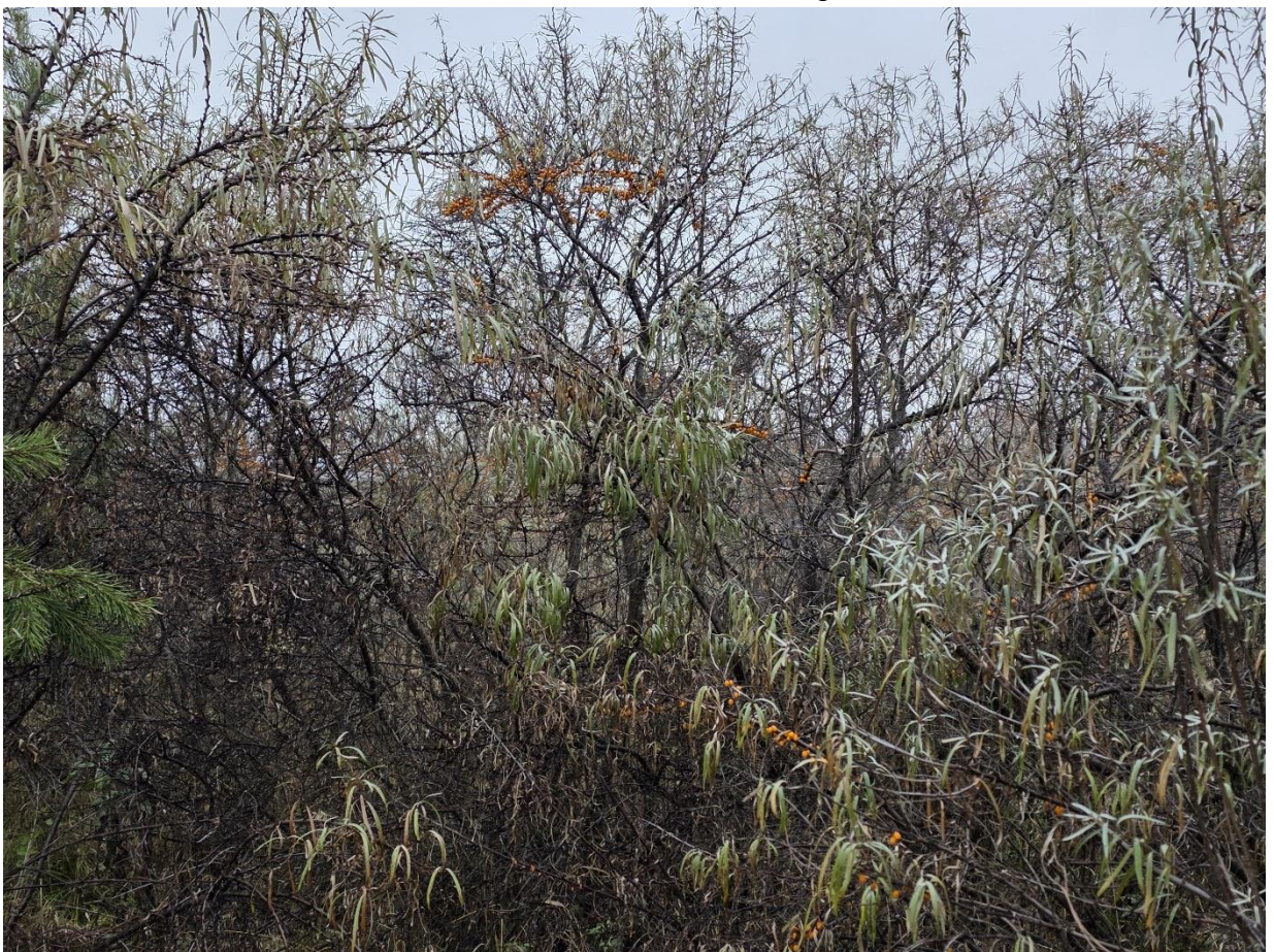
Фото 18. В центре участка №1