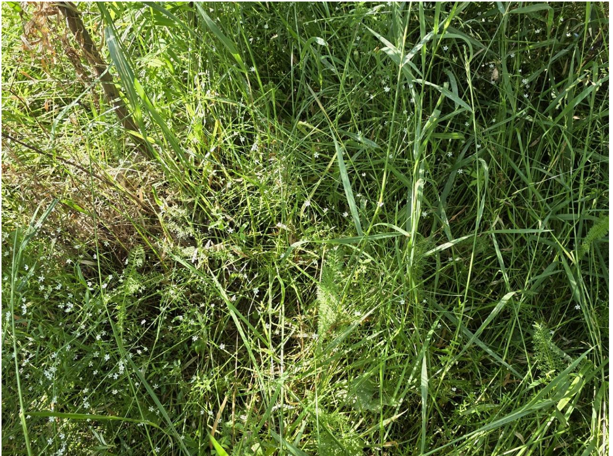
Фото 12. Живой напочвенный покров. Звездчатка малая.