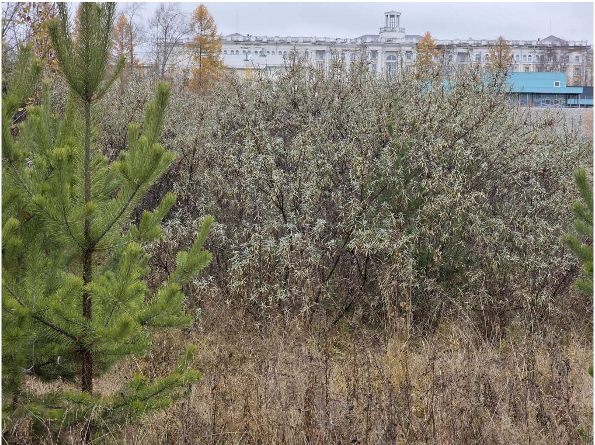
Фото 17. Участок №2 вид со стороны