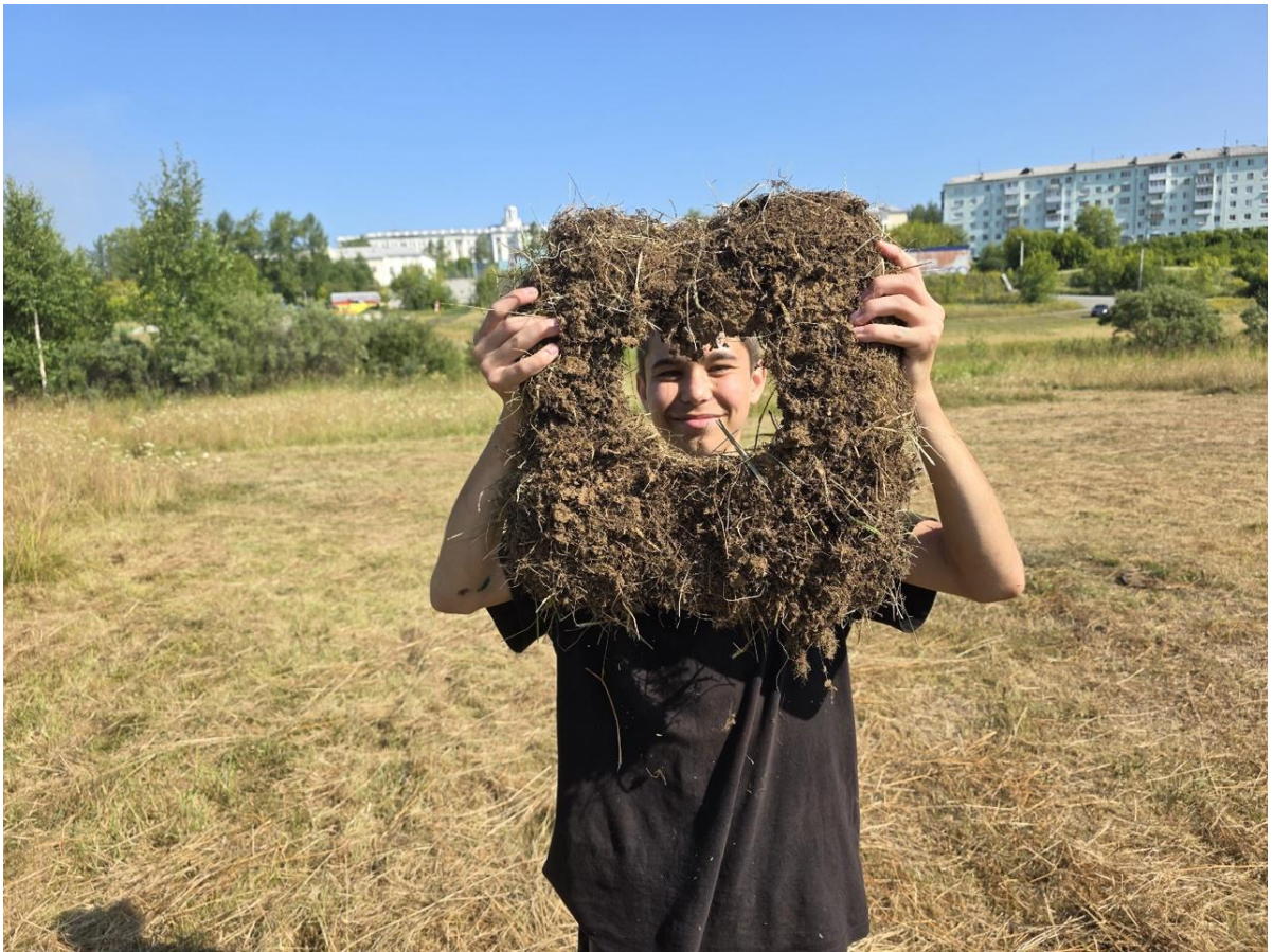
Фото 1. Образец почвы.