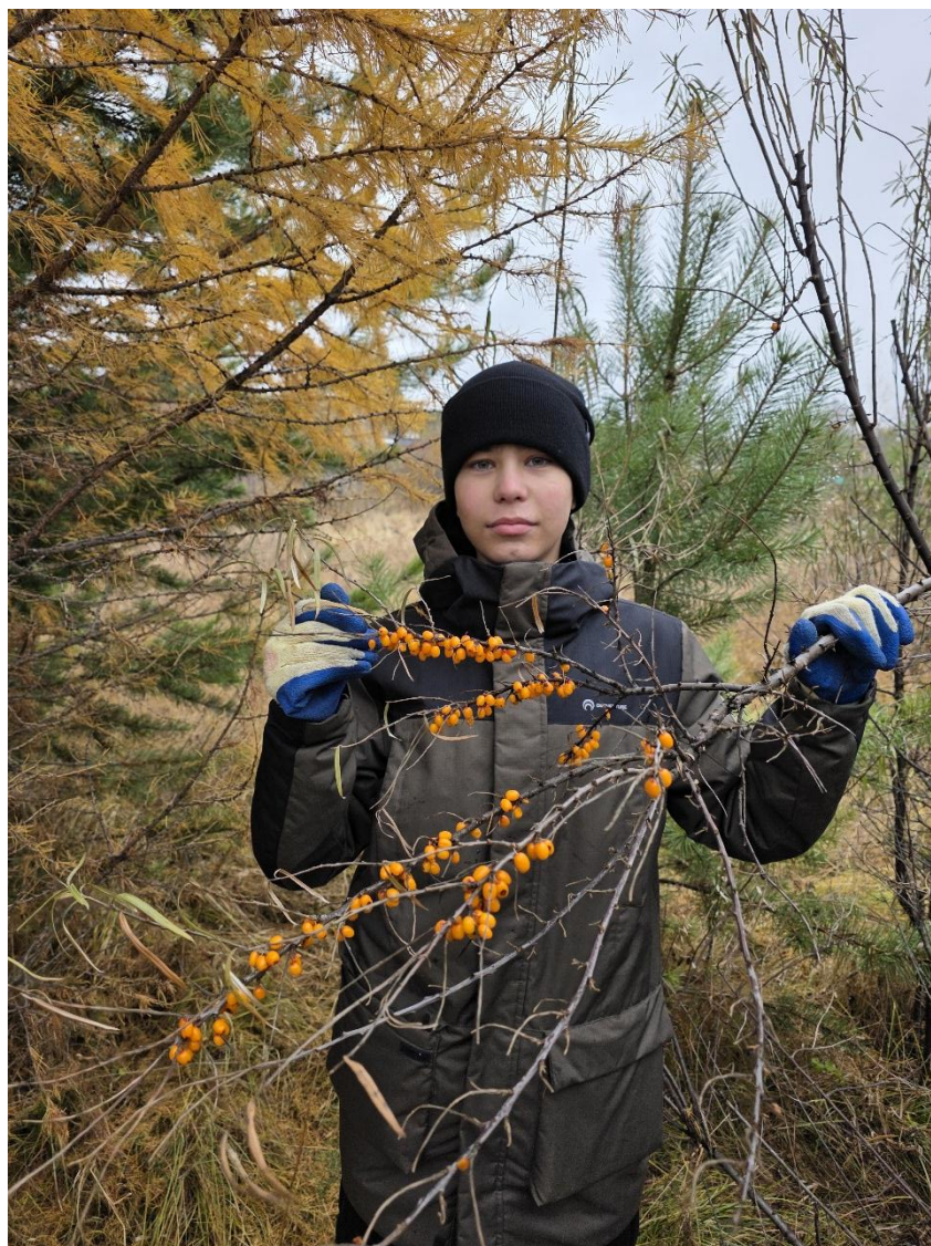
Фото 21. Плодоношение облепихи