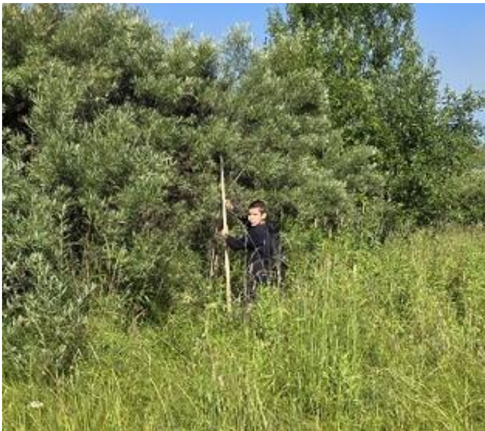
Фото 15. Измерение высоты.