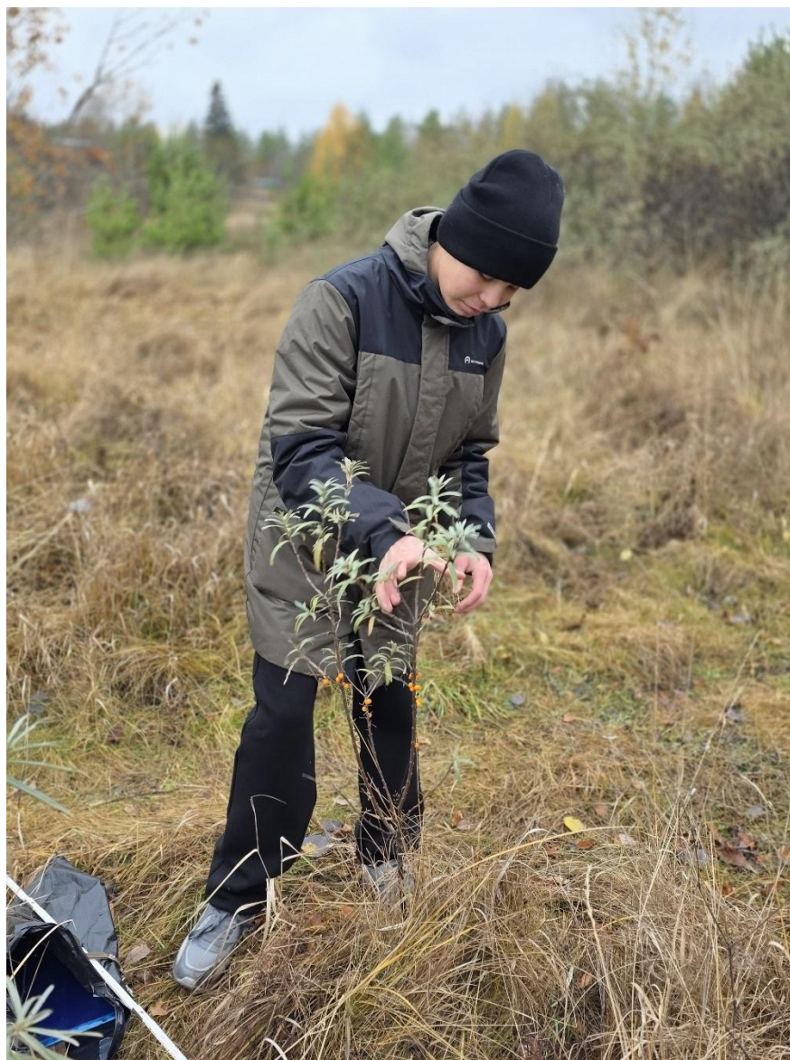
Фото 16. Подрост.