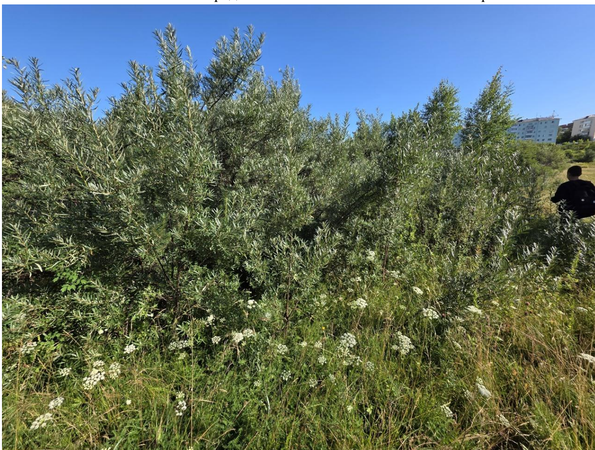
Фото 6. Живой напочвенный покров. Камыш лесной.