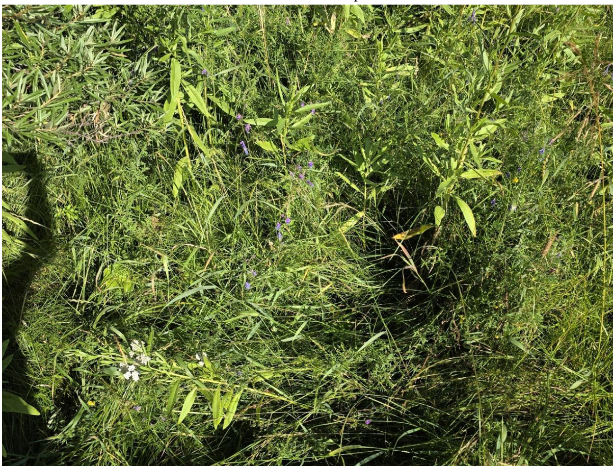
Фото 4. Злаковое разнотравье, бодяк полевой, смолевка малая.