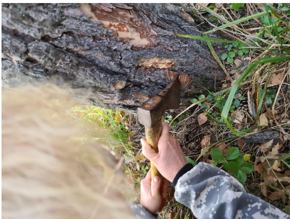
Приложение № 5. Обработка древесной коры на одном из участков наблюдений.