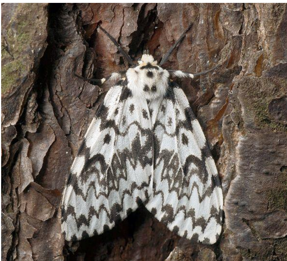
Приложение № 3. Взрослая бабочка шелкопряда-монашенки ( Lymantria monacha )