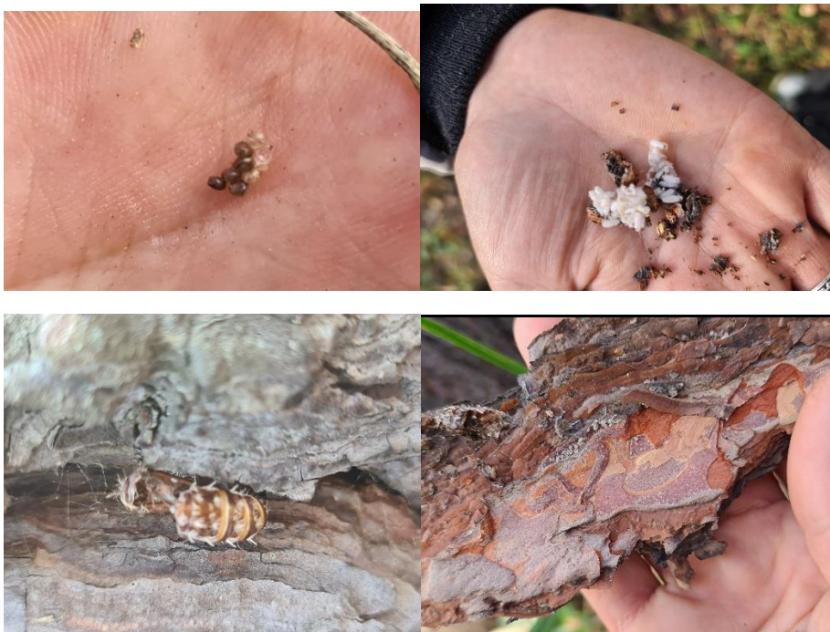
Приложение № 4. Кладки и куколки шелкопряда-монашенки ( Lymantria monacha ).