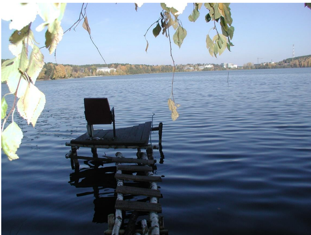
Приложение № 2. Вид берега озера Малый Теренкуль