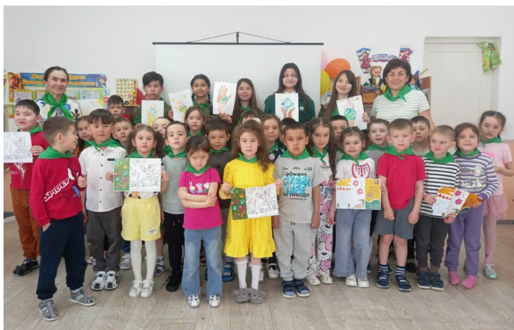
Агитационная работа в детском садике «Сулпылар»