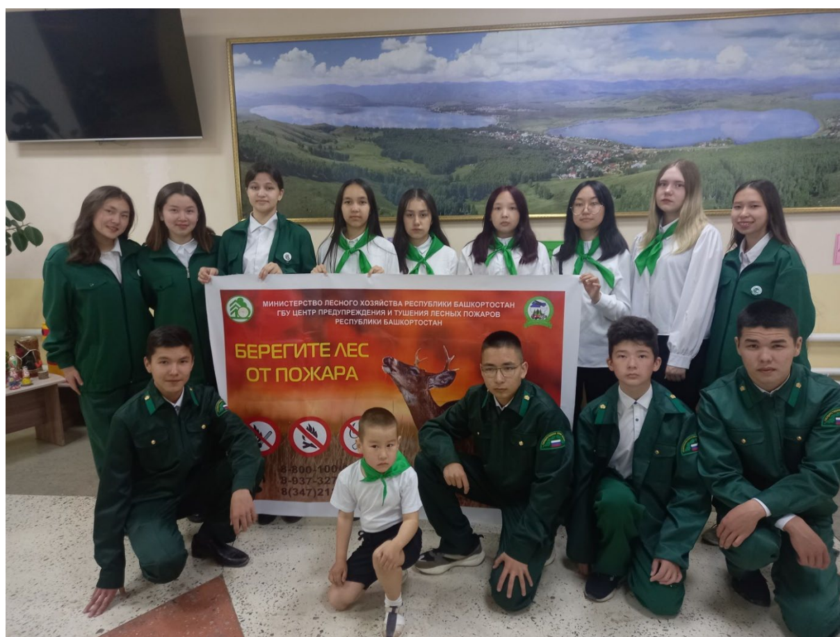
Выпуск аншлага, выступление агитбригады в Доме молодежи.