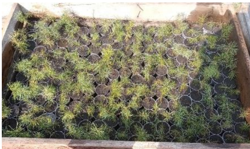
Фото № 9. Сеянцы сосны обыкновенной (весна 2024 года)