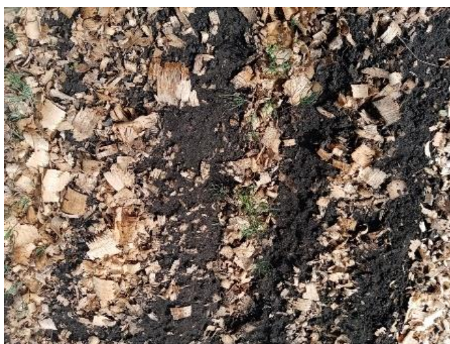
Фото № 4-5. Всходы сосны обыкновенной (июль 2023 года)