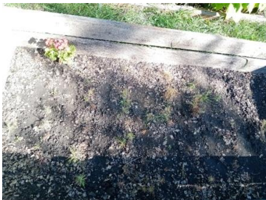
Фото № 8. Сеянцы сосны обыкновенной (сентябрь 2023 года)