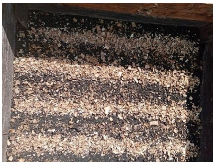
Фото № 3. Мульчирование опилками посадок сосны обыкновенной