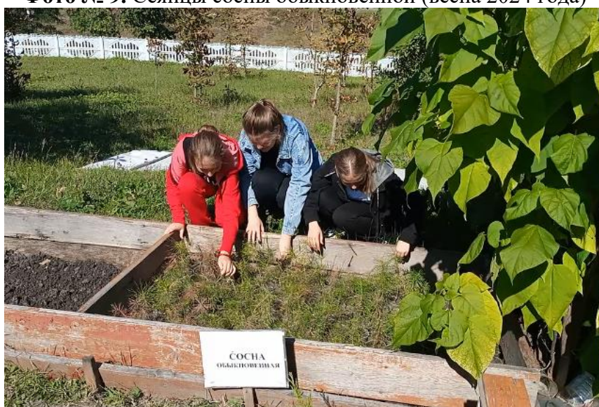
Фото № 10. Уход за сеянцами сосны обыкновенной