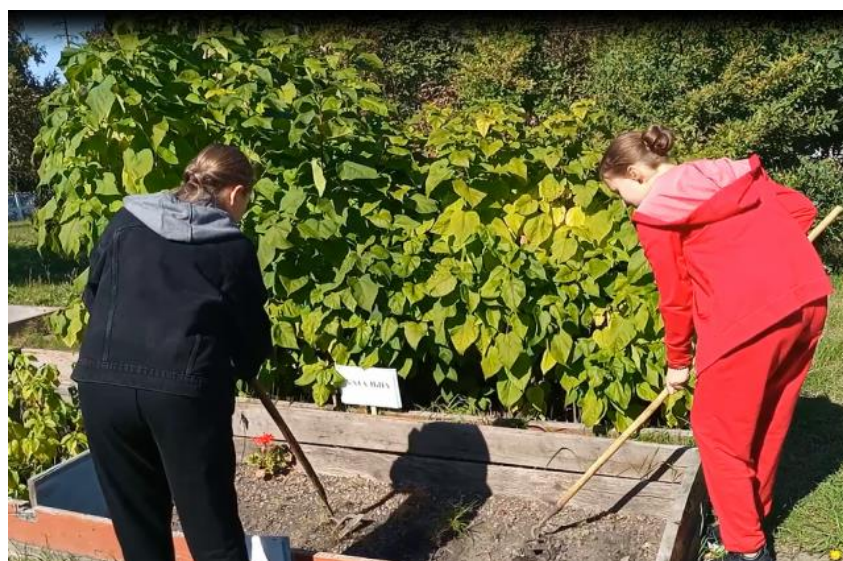
Фото № 6-7. Уход за всходами сосны обыкновенной