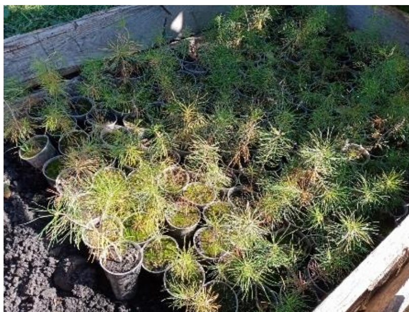
Фото № 11-12. Саженцы сосны обыкновенной (весна 2025 года)