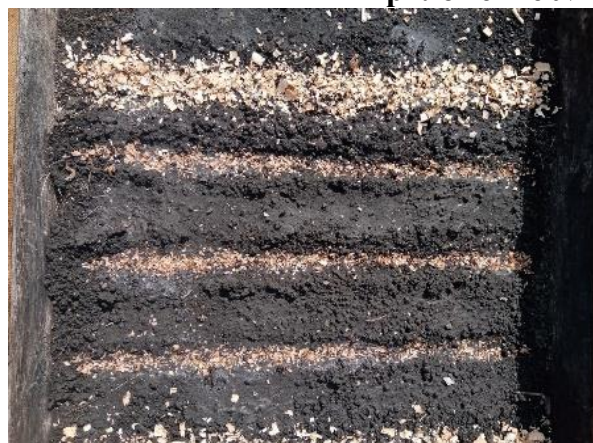
Фото № 1-2. Посадка семян сосны обыкновенной (весна 2023 года)