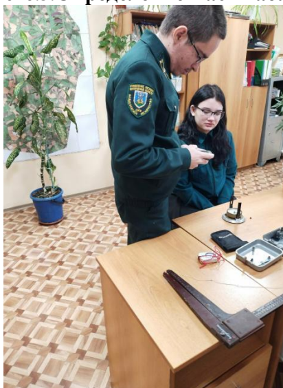
Фото.4. Проверка оборудования перед выездом в лесной массив