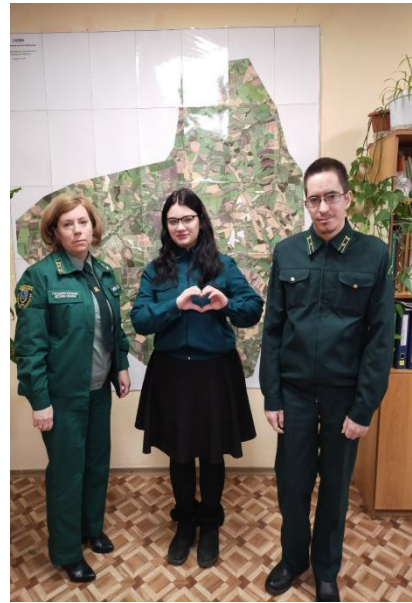
Фото.7. Я сделала правильный выбор!