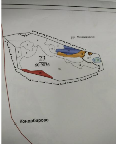
Фото.3. Определение масштаба работ