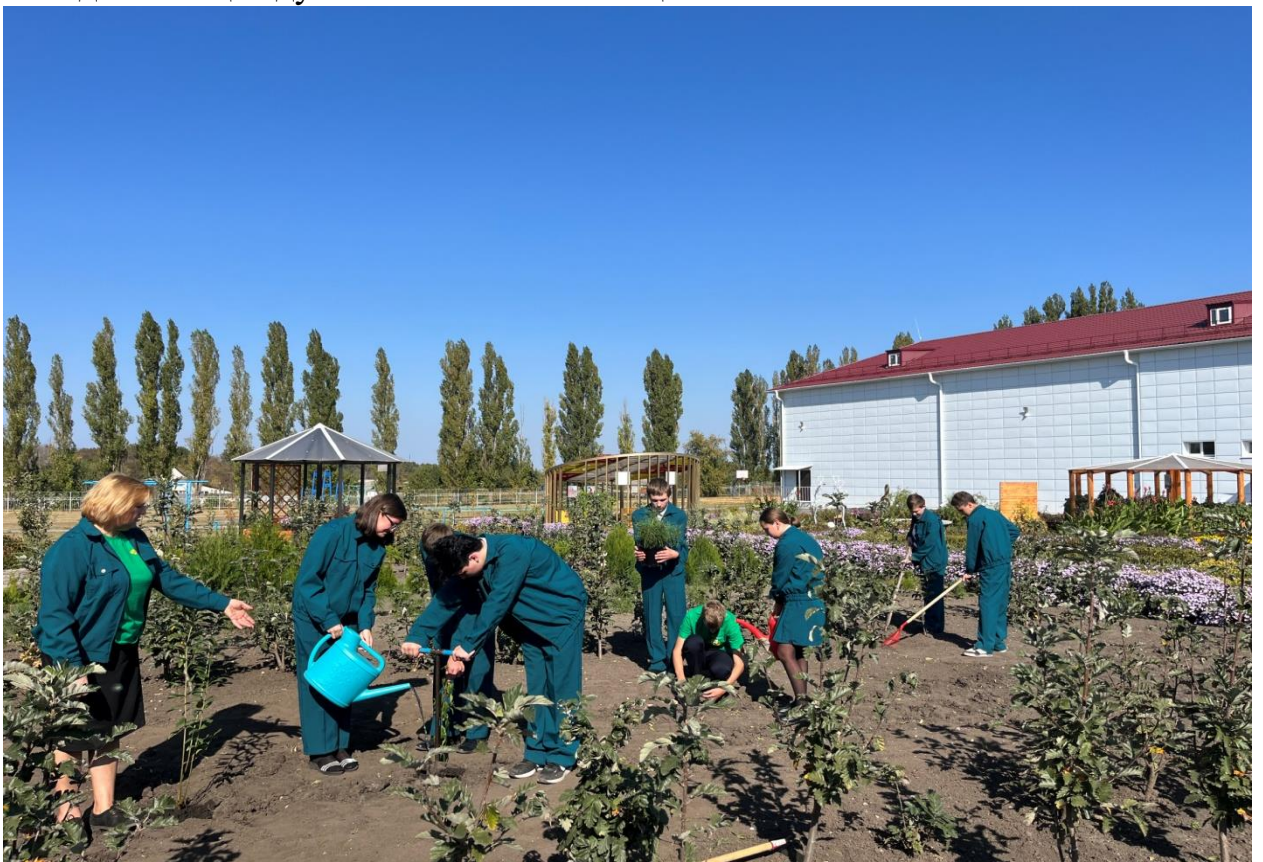
Работа в питомнике