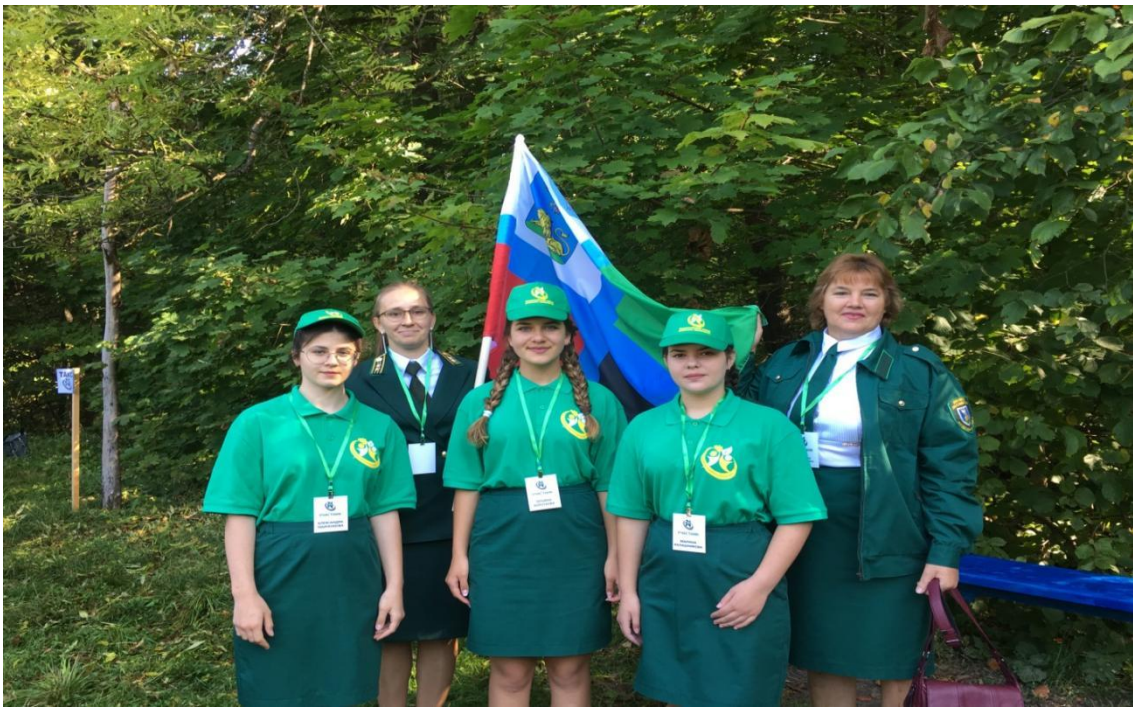
Вперёд к победе!

Когда я стала взрослой и жизненный путь подсказывает выбрать профессию лесника, решила найти больше информации из различных источников.