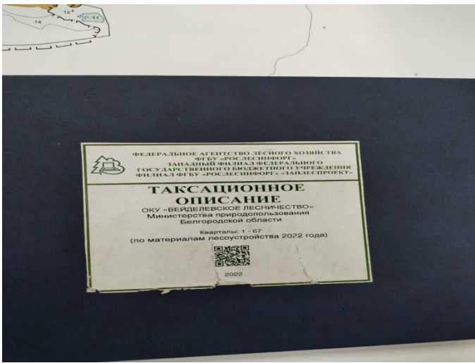
Фото.5. Работа с журналом