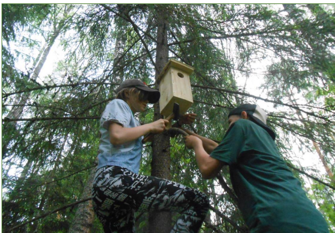
Фото 6. Закрепление скворечника.