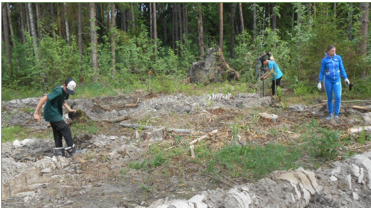
Фото 5. Посадка саженцев сосны обыкновенной.