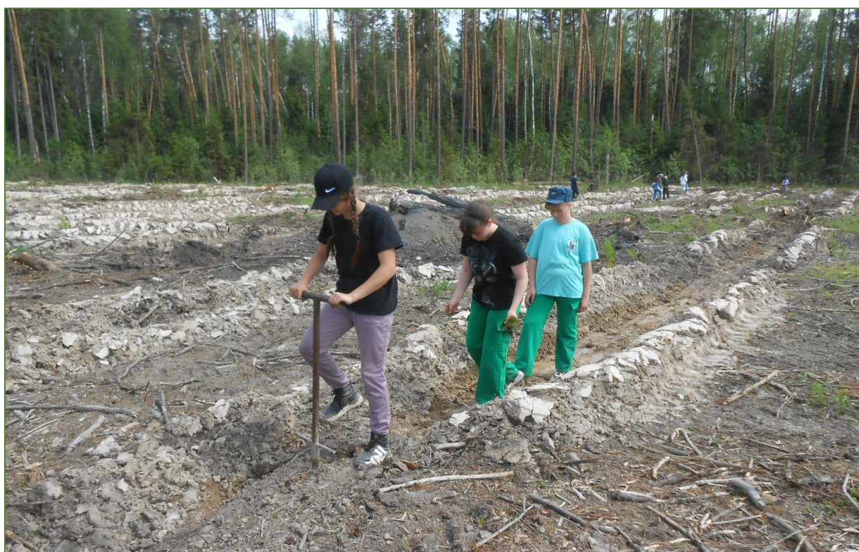
Фото 4. Посадка саженцев сосны обыкновенной.