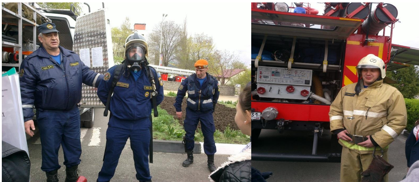
Встреча со специалистами МКУ управление по делам ГО и ЧС Старооскольского городского округа