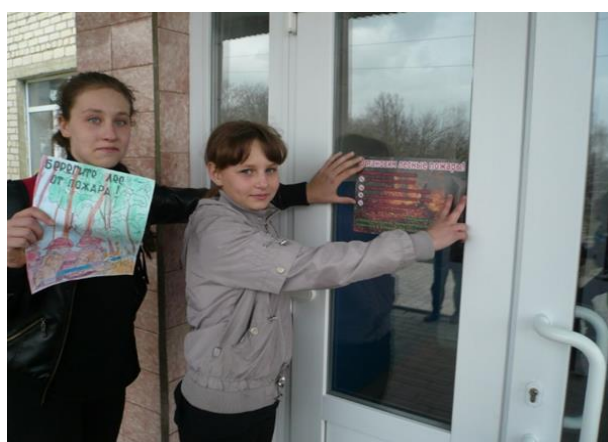
Размещение листовок в окрестностях села Федосеевка