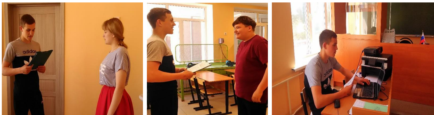
Анкетирование среди учащихся МБОУ «ОО Каплинская школа»: «Чем опасен пожар в лесу?»