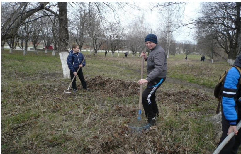
Субботники по очистке лесных массивов - парк Революции