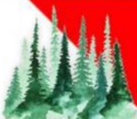
Изготовление противопожарных буклетов