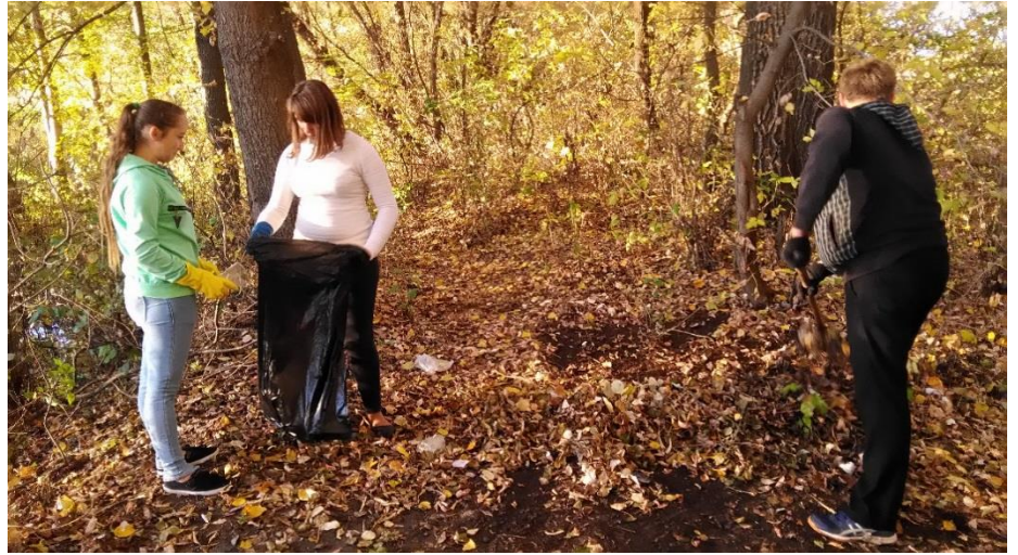
Субботники по очистке лесных массивов - р. Оскол