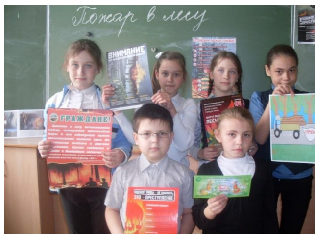
Викторина «Пожар легче предупредить, чем тушить!»