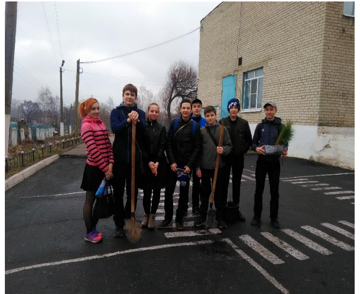
Работа в питомнике на пришкольном участке по выращиванию саженцев