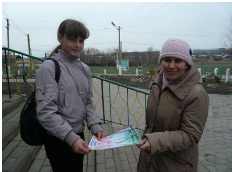
Распространение листовок среди населения села Федосеевка