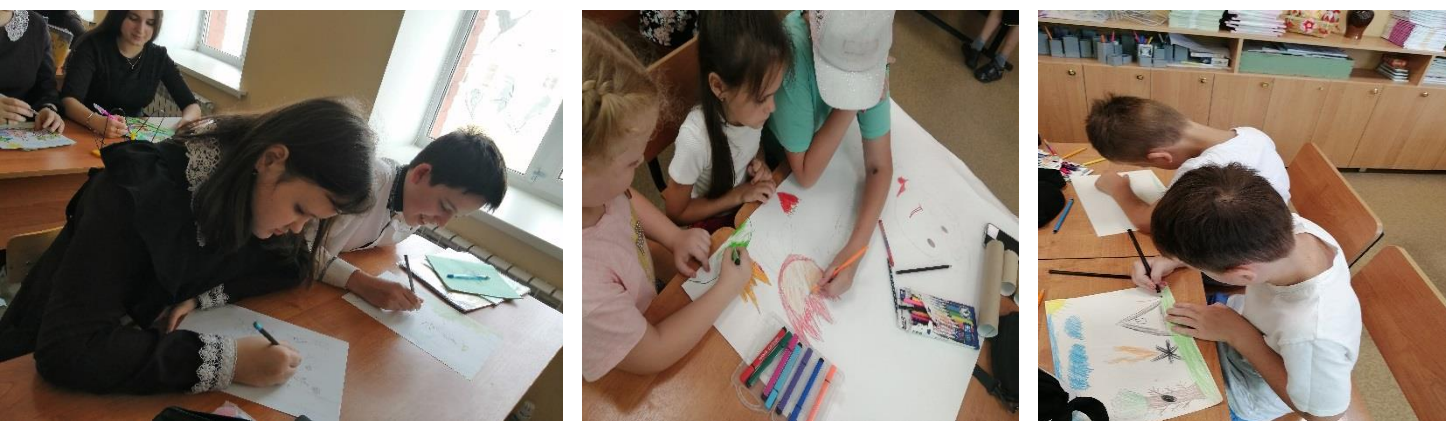
Изготовление противопожарных листовок