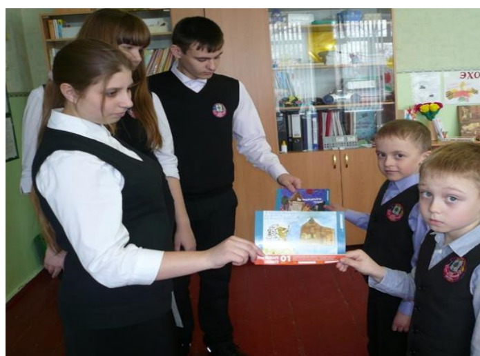
Проведение классных часов для младших школьников на темы: «Правила поведения в лесу», «Опасность лесных пожаров»