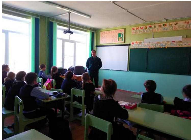
Встреча со специалистами ОКУ «Старооскольское лесничество»