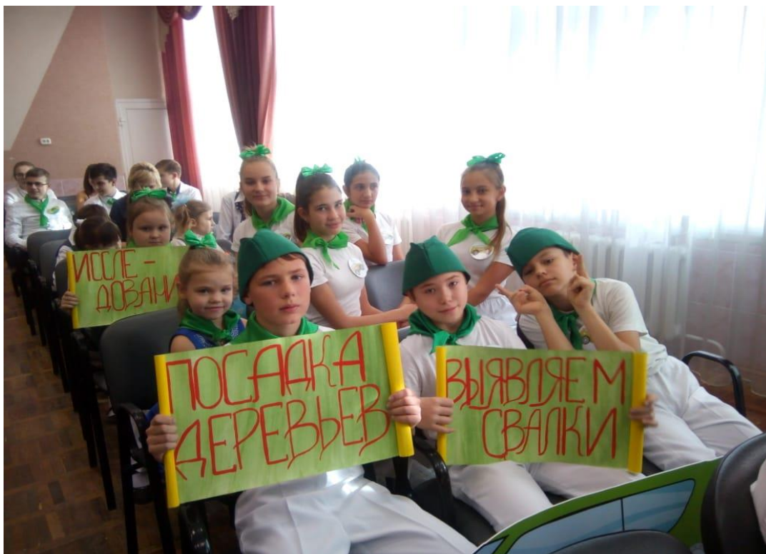
Выступление агитбригады школьного лесничества «Зеленый друг» МБОУ «ОО Каплинская школа»