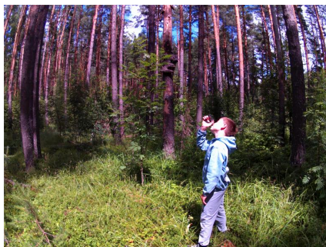
Измерение высоты дерева