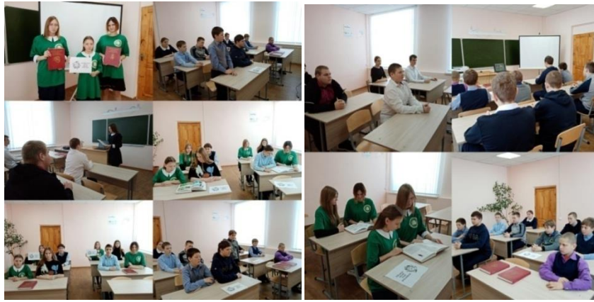
21 марта Международный день лесов