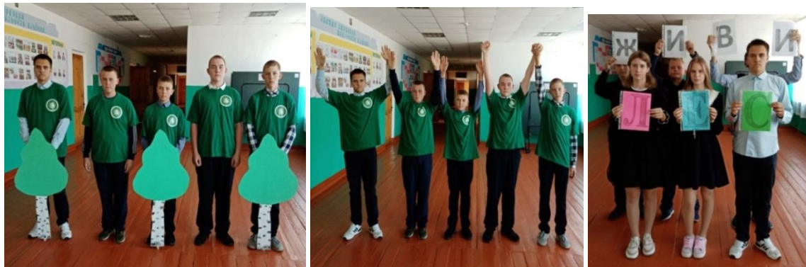
1 апреля - Международный день птиц