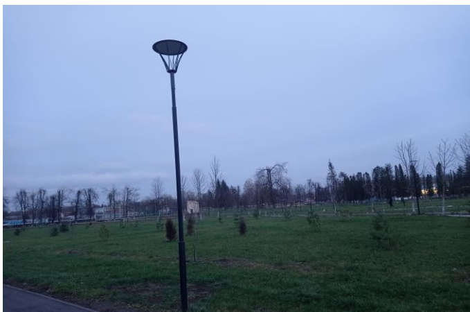
Фото 11. (2024 год)

Городской парк культуры и отдыха до и после реконструкции.