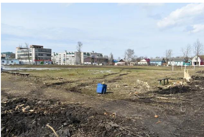
Фото10. (2021 год)