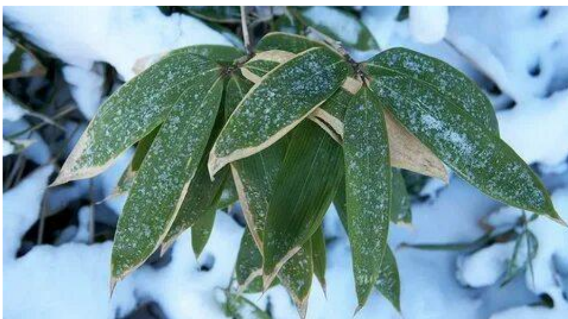
Рис. 2 Повреждение листьев Саза в зимнее время года.