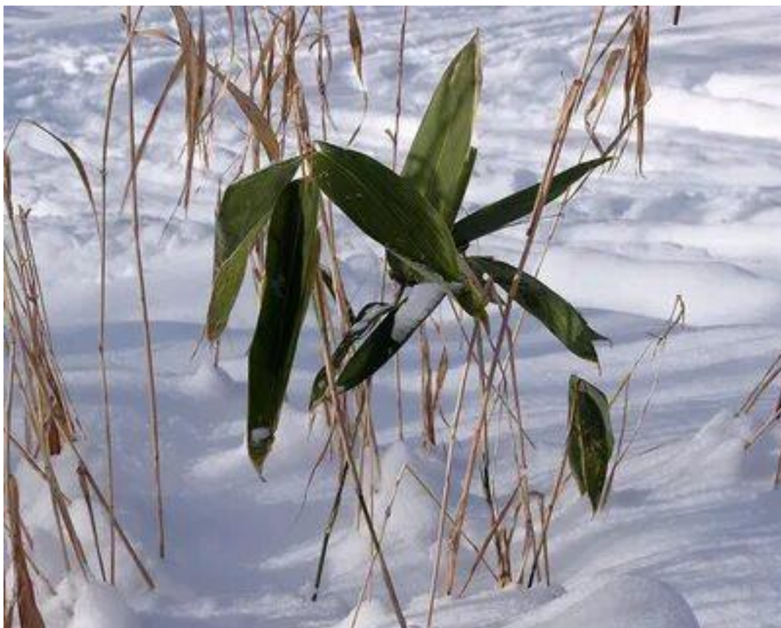
Рис. 1 Саза (курильский бамбук) под снежным покровом.