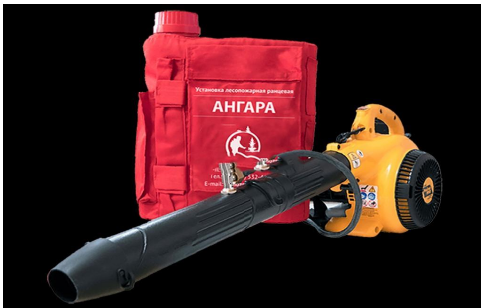
Фото 9. Установка противопожарная ранцевая «Ангара»

воздушного потока («газ»). Подача воды из наплечного ранца осуществляется с помощью гибкого прорезиненного шланга через запорную арматуру (кран), при этом расход регулируется степенью перекрытия крана. Вес всей конструкции с полной заправкой водой и топливом — около 30 кг, которые равномерно распределены между рукой и на спине пожарного.