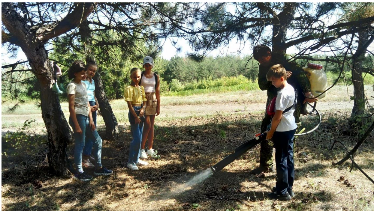
Фото 13. Ходовые испытания противопожарного агрегата

Полностью собранный агрегат пожаротушения был предварительно испытан при различных режимах подачи воздуха и воды. Результаты опытов показали, что данная установка может быть использована при тушении природных пожаров.