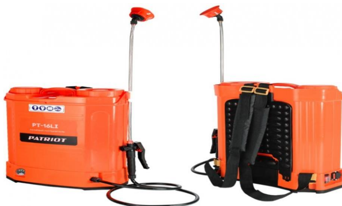
Фото 6. Аккумуляторный ранцевый опрыскиватель

Использование аккумуляторных ранцевых опрыскивателей нашло широкое применение при тушении пожаров в природных экосистемах Донецкой Народной Республики. Это вызвано, прежде всего, их простотой и надёжностью при использовании на пожарах.