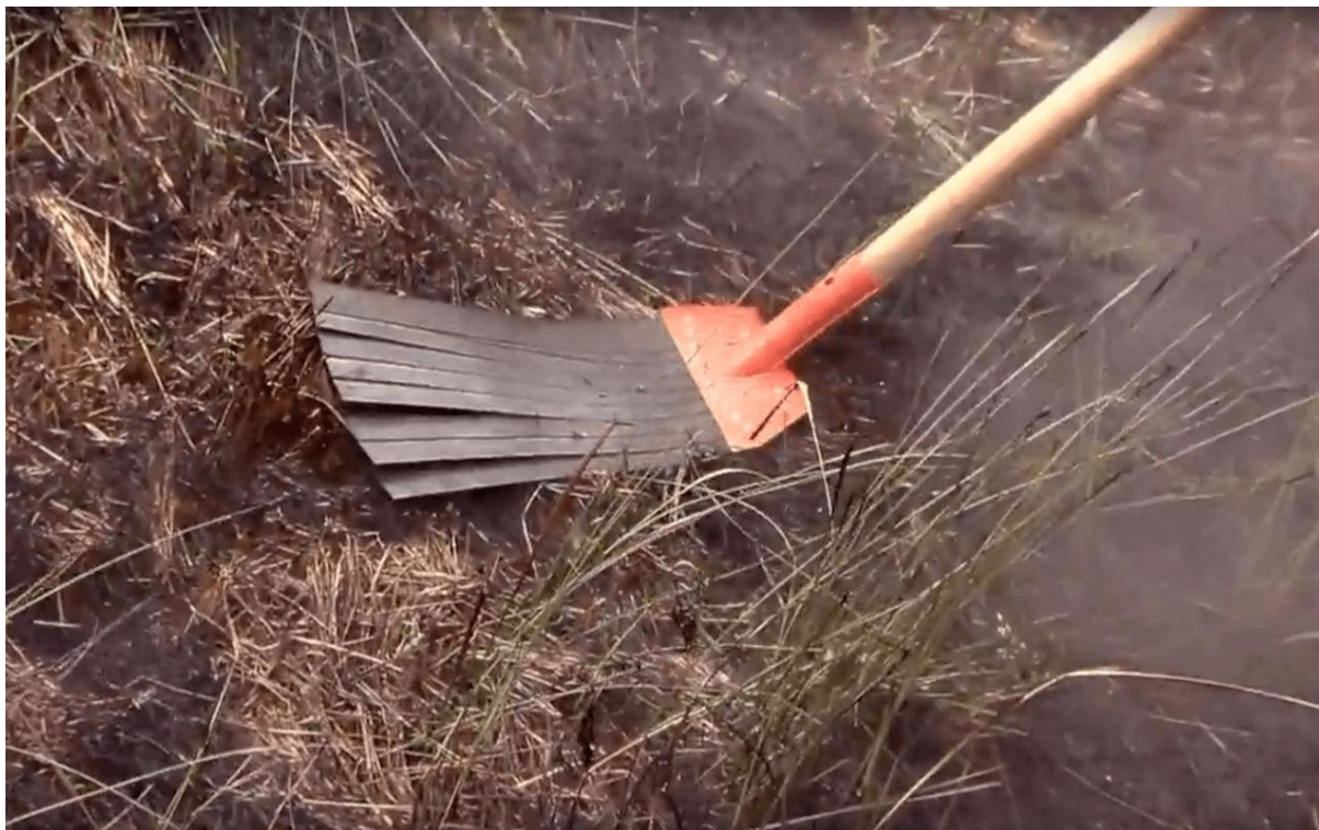
Фото1. Хлопушка противопожарная

Так называемые «хлопушки» - резиновые коврики, закрепленные на деревянном держаке. Ими производятся сильные удары, «прихлопывающие» пламя и отбрасывающие горящие частицы на пройденную огнем площадь. Хлопушкой желателно наносить удар «с протяжкой», на какое-то время оставляя потушенный участок закрытым для доступа воздуха. Это дополнительно придавливает горящую траву и изолирует ее от притока кислорода, не давая разгореться снова и позволяя горючим материалам немного остыть. Хлопушка «работает» без воды и топлива, имеет относительно маленькие вес, размер и стоимость. При этом эффективность этого способа тушения выше, чем кажется на первый взгляд. Хлопушки можно применять при высоте пламени до полметра.