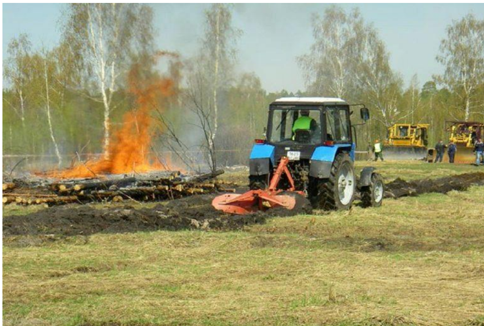
Фото 3. Создание минерализованной полосы во время тушения лесного пожара

ветвям и кустарникам огонь может перекинуться на нетронутую огнем площадь), и отгрести граблями, тряпкой или лопатой горючие материалы и подстилки как можно дальше от создаваемой полосы. В обязательном порядке обкапывается сгоревшая подстилка хвойников, так как нижний «мулевый» слой хвойной подстилки зачастую оторфован и огонь может «переползти» практически под землёй становясь источником нового пожара.