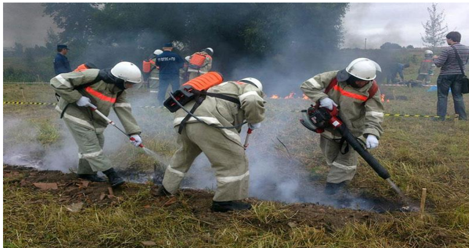
Фото 10. Тушение пожаров в природных экосистемах противопожарными агрегатами на основе воздуходувок

Группа, укомплектованная воздуходувками, берет с собой запас готового топлива, минимальный набор инструментов (отвертки, свечной ключ, пассатижи, шило, нож) и протирочный материал, запас концентрированного смачивателя и удобный, компактный ковшик для наполнения бака водой.