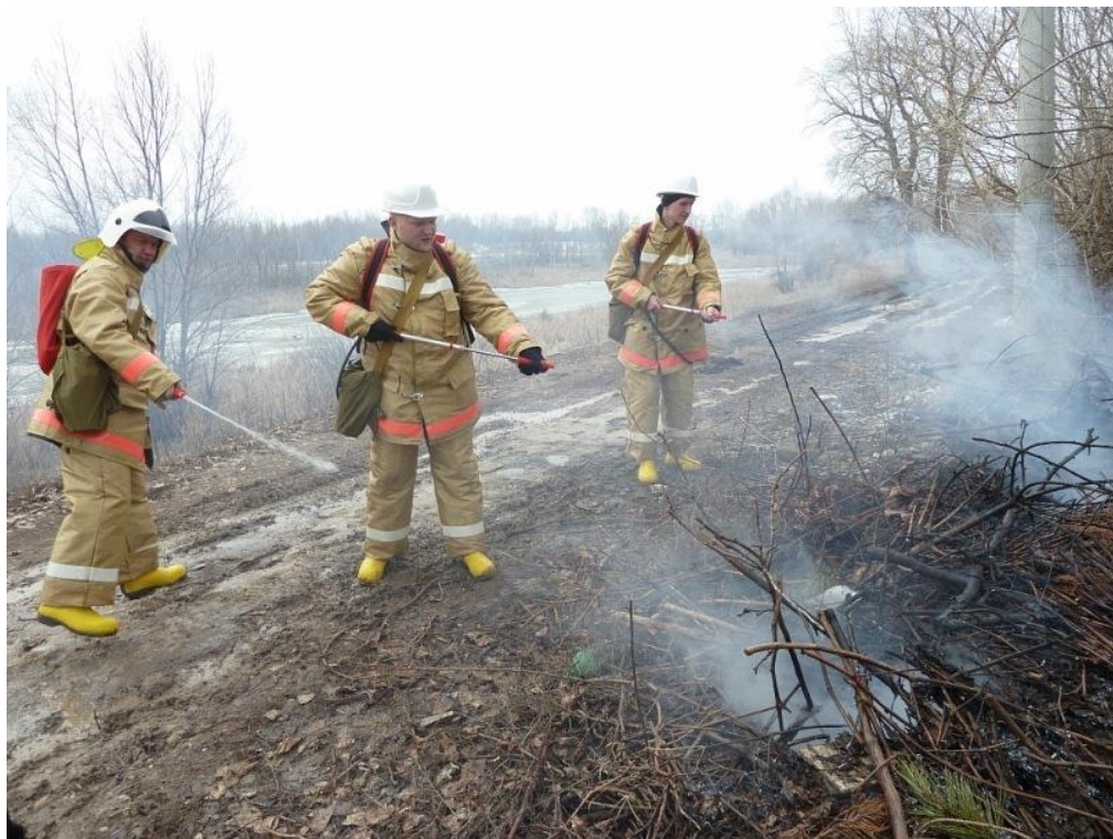
Фото 5. Тушение пожара с помощью РЛО-18 «Ермак»

легко перемещаться в условиях сильного подлеска из кустарников пород, свойственного природной структуре наших лесов.