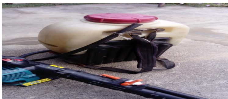
Фото 12. Ручной противопожарный агрегат конструкции «Шахтерского школьного лесничества» в сборе

В качестве заплечного ранца были использованы два наплечных ранца – пластмассовый, от мотоопрыскивателями Solo 433, главным преимуществом которого была удобная эргономическая конструкция, позволяющая легко перемещать на себе 23 литра воды и мягкий прорезиненный рюкзак от РЛО – 18 «Ермак», который позволяет быть более подвижным при тушении лесных пожаров в насаждениях имеющих густой подлесок.