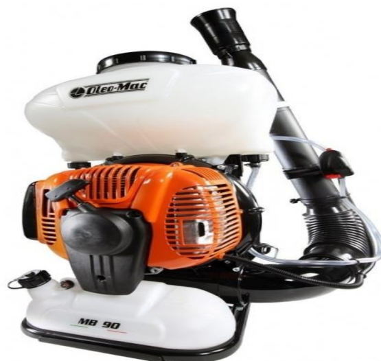
Фото 7. Мотоопрыскиватель

недостаток – громоздкость агрегата, что делает его практически не эффективных при тушении лесных пожаров в насаждениях с подлеском и густым подростом. В основном, требования к эксплуатации мотоопрыскивателей схожи с работой воздуходувки.