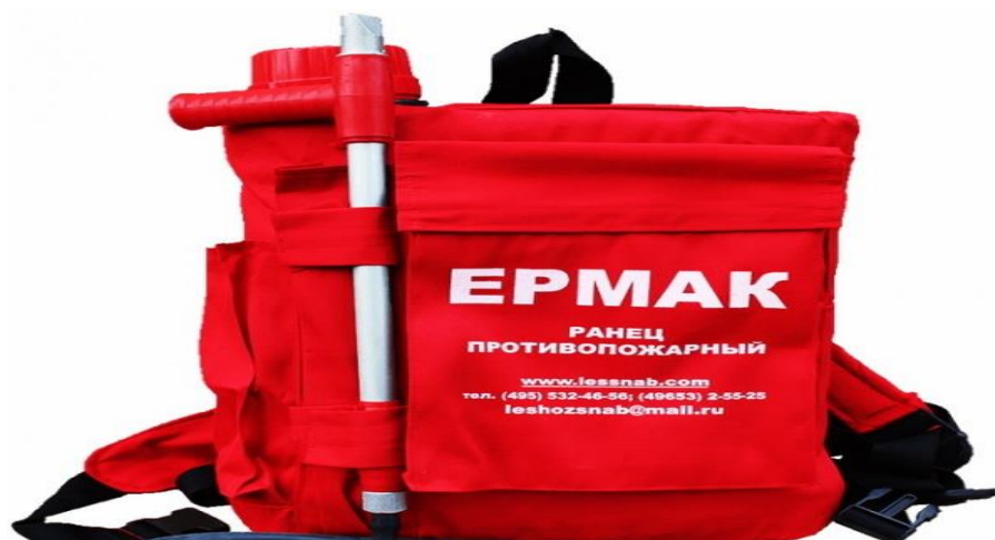
Фото 4. РЛЮ-18 «Ермак»

струю. Компактная струя эффективно сбивает пламя и охлаждает горящую растительность, распыленная — смачивает горящие поверхности, что широко используется при подготовке опорных полос при проведении направленного отжига. Полного ранца хватает в среднем на 10-15 минут интенсивной работы. Если добавить в воду смачиватель, пенообразователь или огнетушащий состав, обрабатываемую с одной заправки площадь можно увеличить примерно на 30-50 %. Желательно использовать специальные биоразлагаемые смачиватели, но при их отсутствии можно воспользоваться даже обычным жидким мылом или дешёвым фосфатным стиральным порошком.