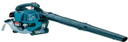
Фото 11. Бензовоздуходувка Makita

В качестве заплечного ранца были использованы два наплечных ранца – пластмассовый, от мотоопрыскивателями Solo 433, главным преимуществом которого была удобная эргономическая конструкция, позволяющая легко перемещать на себе 23 литра воды и мягкий прорезиненный рюкзак от РЛО – 18 «Ермак», который позволяет быть более подвижным при тушении лесных пожаров в насаждениях имеющих густой подлесок.