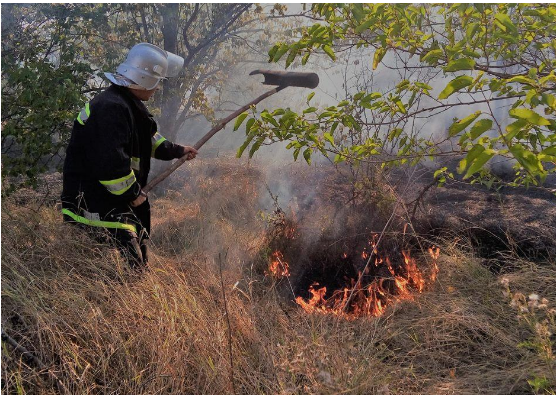
Фото 2. Работа противопожарной хлопушкой

Данными противопожарными устройствами комплектуются расчёты пожарных команд. Также можно использовать веники (пучки веток) из лиственных пород деревьев. Ветви нарезаются секатором или другими режущими предметами с небольших деревьев и кустарников и немедленно используются для тушения огня, когда нет других противопожарных средств. Бесплезно тушить хлопушкой тлеющие горючие материалы – сухие ветки, и лесную подстилку. Для их тушения лучше использовать другую тактику — смести или отгрести граблями горящие частицы на выгоревшую площадь.