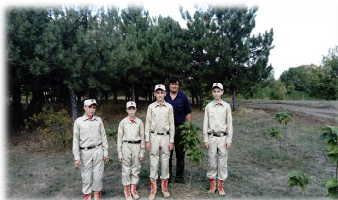
Фото «Противопожарное патрулирование урочища «Виктория – 3», Шахтерского лесничества – 2022г.