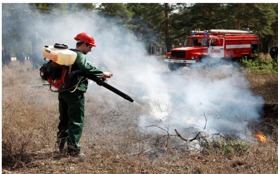
Фото 8 Тушение пожара мотоопрыскивателем

Воздуходувка состоит из воздушного компрессора с бензиновым двигателем и бака для воды в виде наплечного ранца, скомпонованных в единый агрегат для тушения пожаров. Бензовоздуходувка управляется одной рукой. Как правило, в воздуходувке есть система управления скоростью