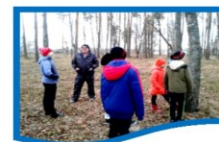
Практическое занятие: определение компонентов леса.

Лес и воздух: главный компонент атмосферного воздуха – азот (78%). Он необходим для дыхания растений, животных, микроорганизмов.