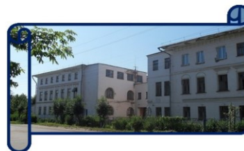
ОГБОУ Вичугская школа-интернат №2

Подросток – кустарники, реже древесные породы, произрастающие под пологом леса, не способные сформировать древостой в данных условиях (кустарники – жимолость, шиповник, орешник; древесные породы – липа, ольха).